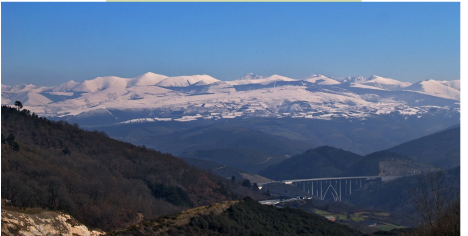
Os Ancares desde Becerreá