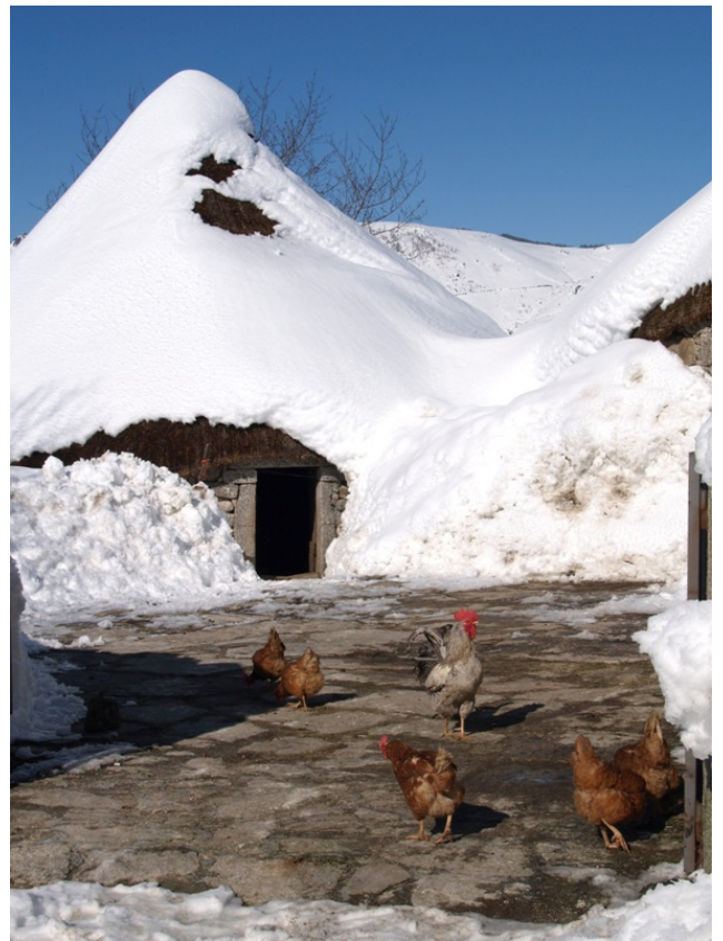
Palloza en Piornedo