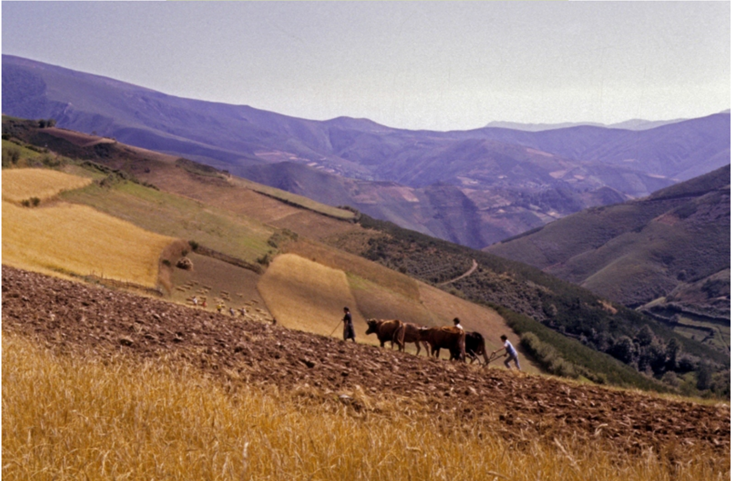
Labrando nos Ancares. (1980 aprox) A vida só é posible se se atopan solucións aos problemas que plantexa. Nos tempos nos que aínda non se popularizara a maquinaria agrícola, cando era preciso, adoptábanse solucións á medida